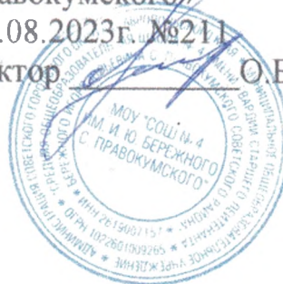
ГРАФИК питания, учащихся в школьной столовой МОУ «СОШ № 4 им. И.Ю. Бережного с. Правокумского» на 2023-2024 учебный год